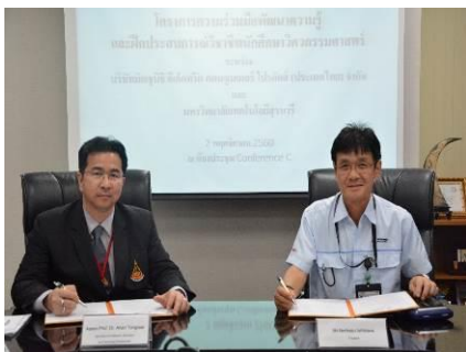
มหาวิทยาลัยเทคโนโลยีสุรนารี

ปี พ.ศ. 2563. รับนักศึกษาสหกิจศึกษาจำนวน 14 คน ปี พ.ศ. 2564. รับนักศึกษาสหกิจศึกษาจำนวน 6 คน