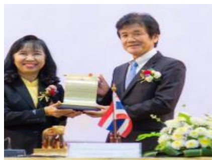
มหาวิทยาลัยอุบลราชธานี